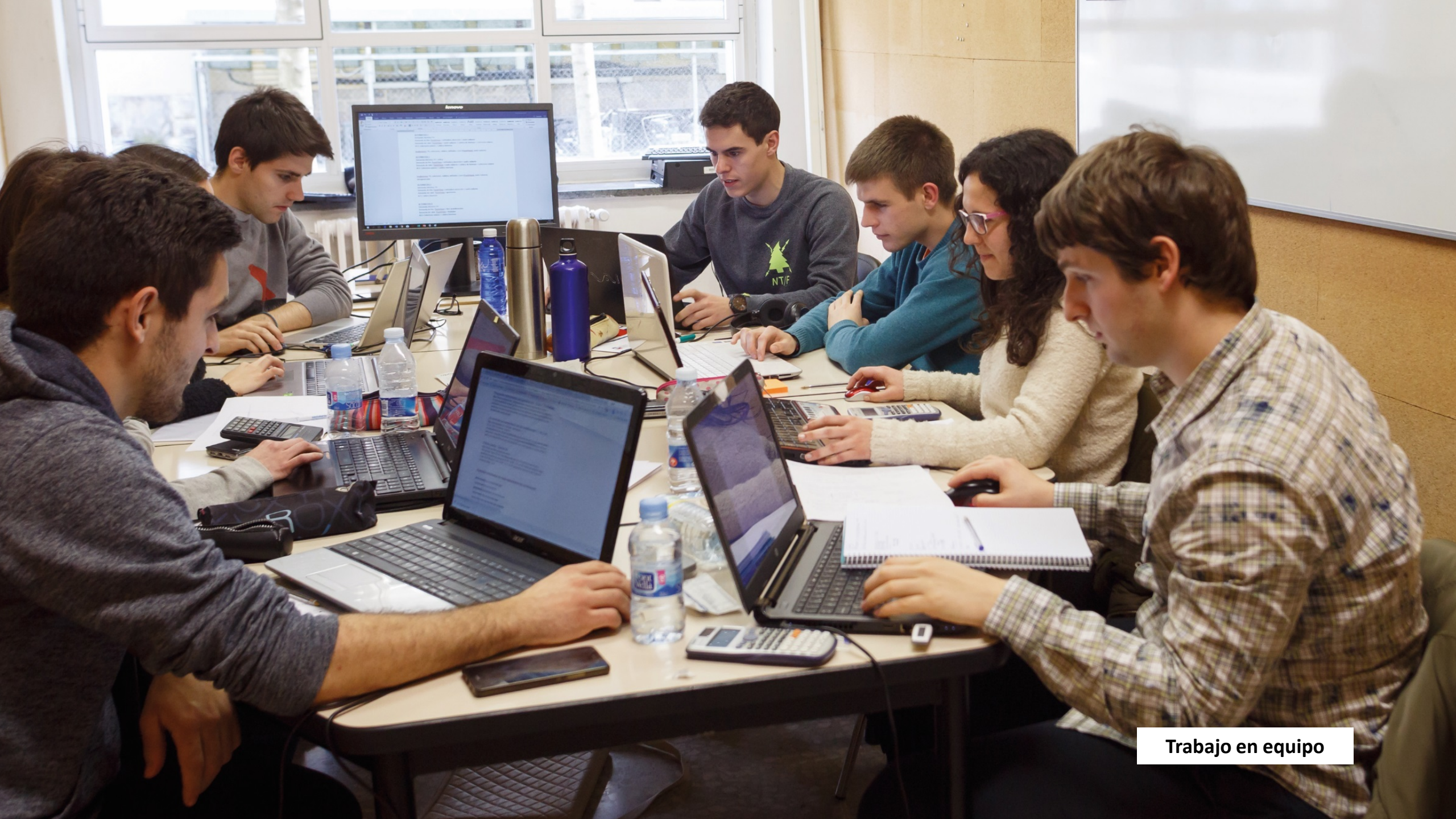
Trabajo en equipo