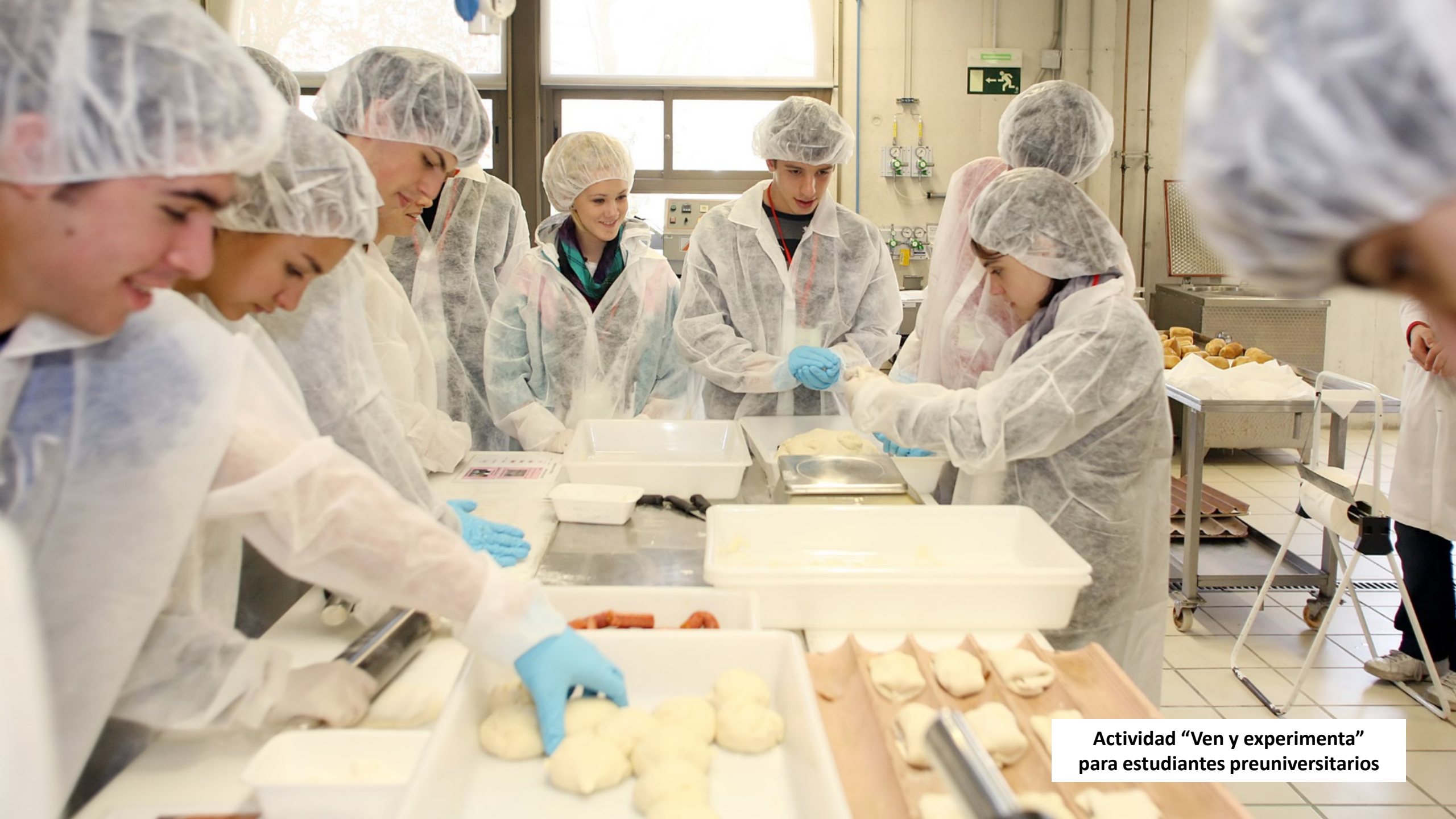
Actividad “Ven y experimenta” para estudiantes preuniversitarios