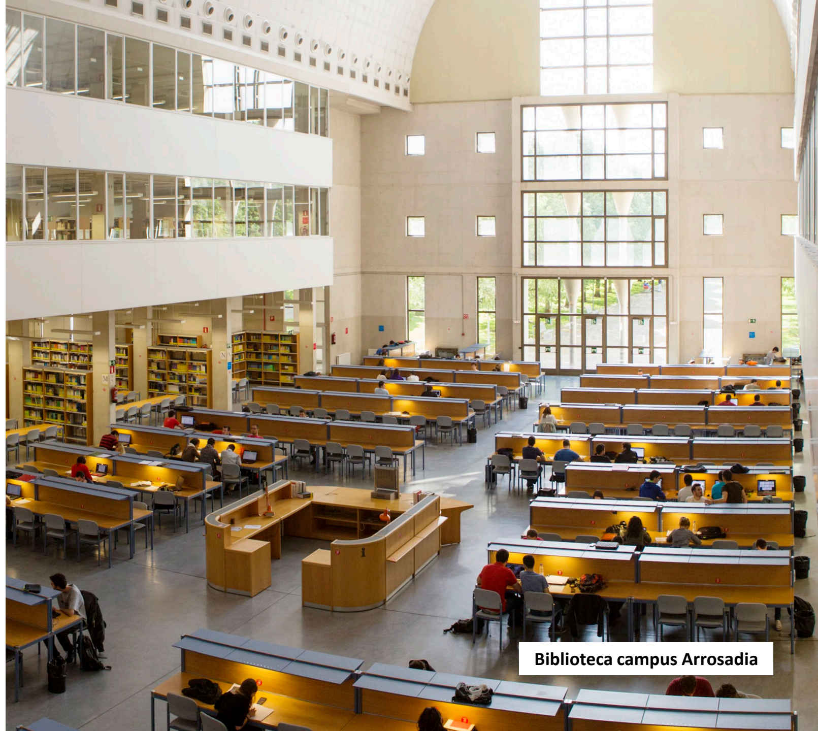
Biblioteca campus Arrosadia