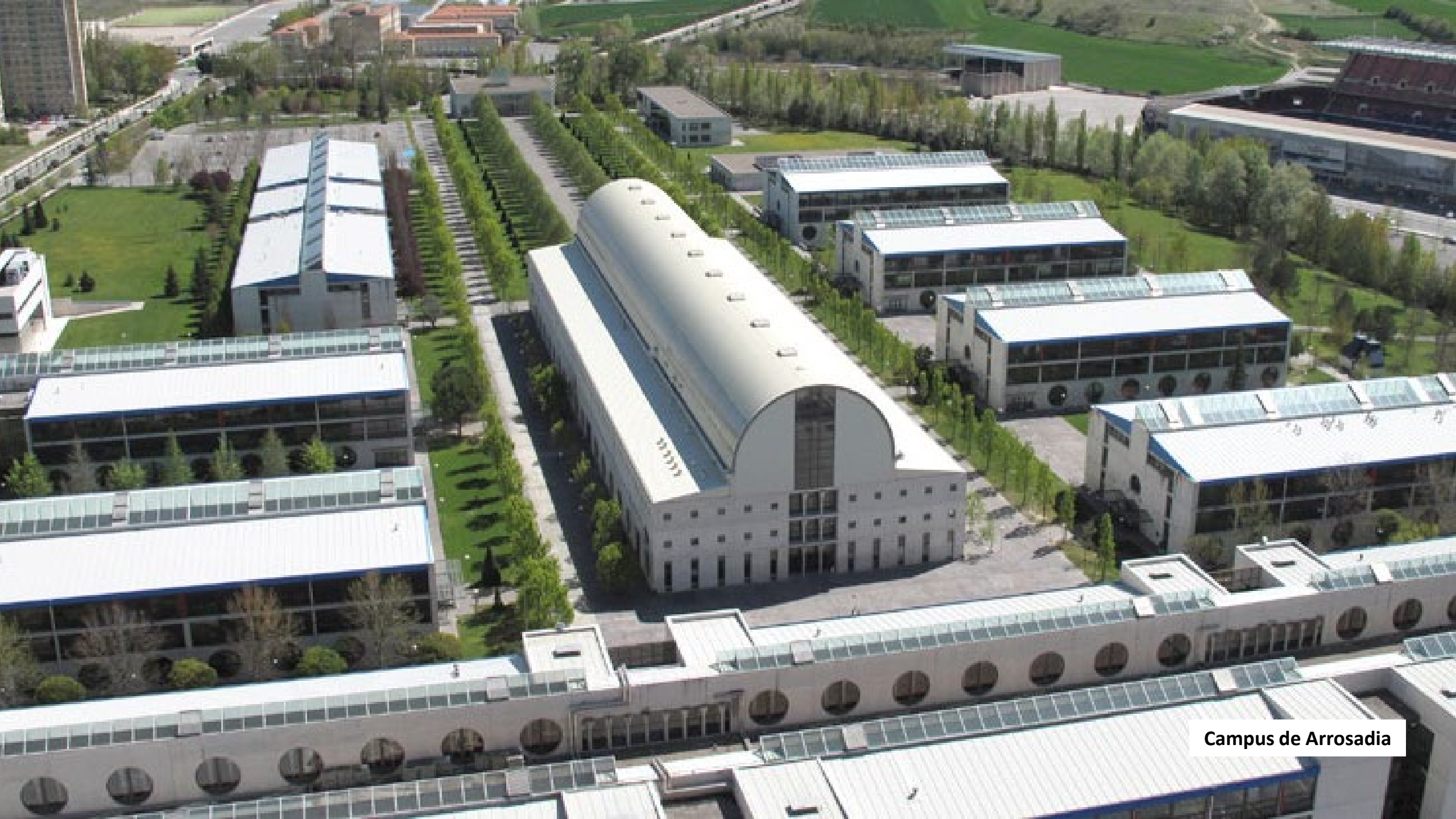
Campus de Arrosadia